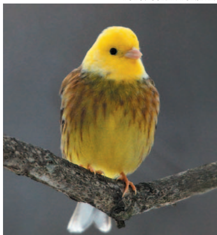
"Kycklingsparven" på Färingsö.