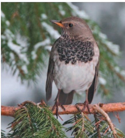
Svarthalsad trast, hane, Duvbo, jan.2010

I det gamla villaområdet Duvbo i Sundbyberg slog sig en svarthalsad trast ned i en trädgård med fågelmatning i december.