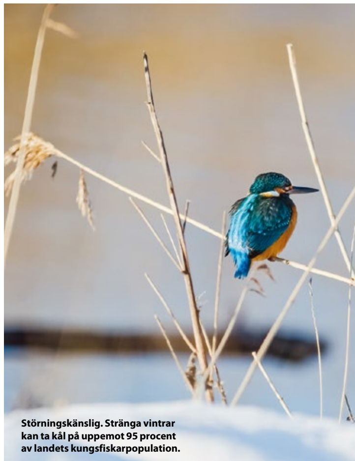
Störningskänslig. Stränga vintrar kan ta kål på upp mot 95 procent av landets kungsfiskarpopulation.

” De energiska kungsfiskarna behöver äta 60 procent av sin egen vikt varje dag