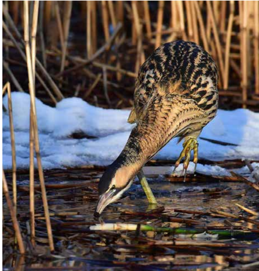
Mycket sakta och försiktigt vadar rördrommen i öppningar i vassen på jakt efter byten.

Fem år senare hade två eller tre rördrommar lite då och då siktats i norra änden av Södsjärdsdammen i Torsviken. Efter att